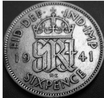
Sixpence van 1941 tijdens de regeerperiode van George VI