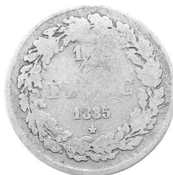
1/2 Fr 1835